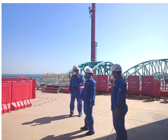
现场组织初期处置