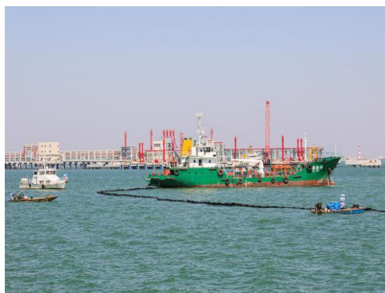
海事海巡、清污作业