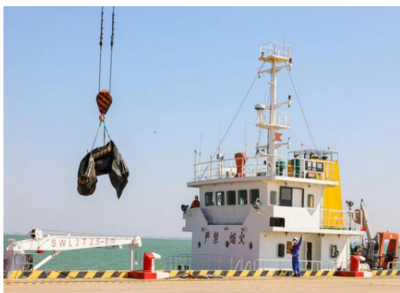
调运后场清污设备设施