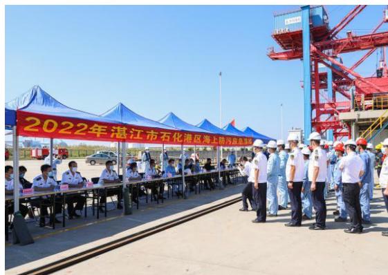
参演单位集中点评