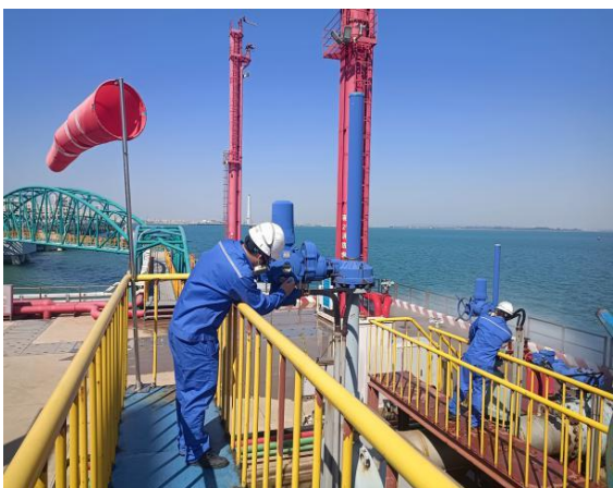
确认阀门关闭、收回输油臂