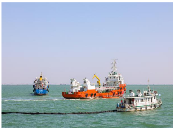
专业清污、围油栏围堵